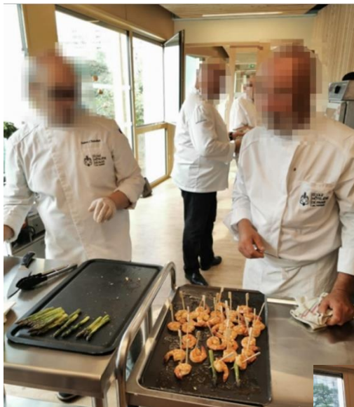
Animation organisée en août 2019 avec l'Ecole Hôtelière de Paris/CFA Médéric